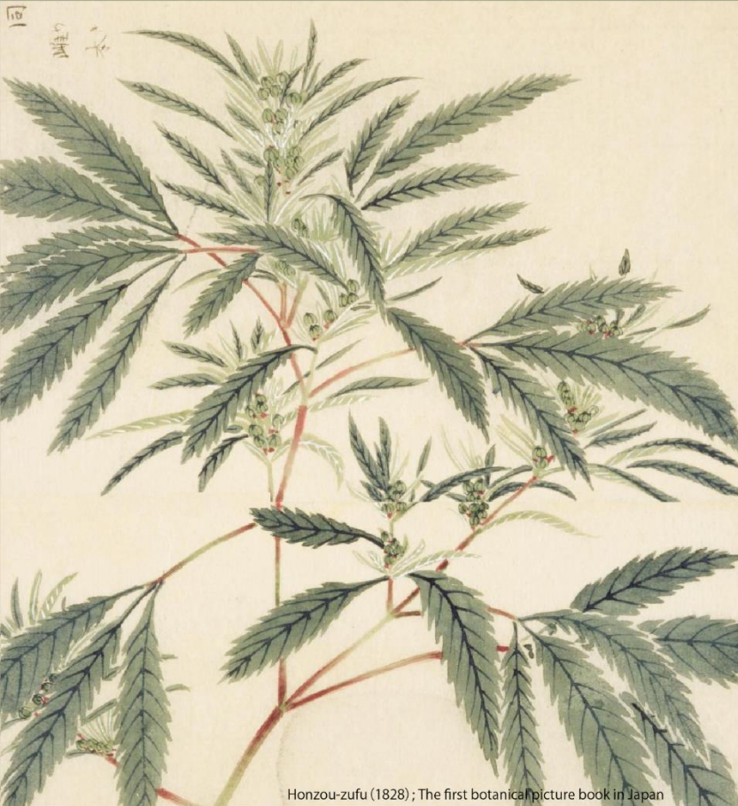
Honzo-zufu (1828); The first botanical picture book in Japan

閉鎖的な日本の状況を打破するために、 私たちは「日本ヘンプ開国キャンペーン」 第1弾としてASACON2019を開催します